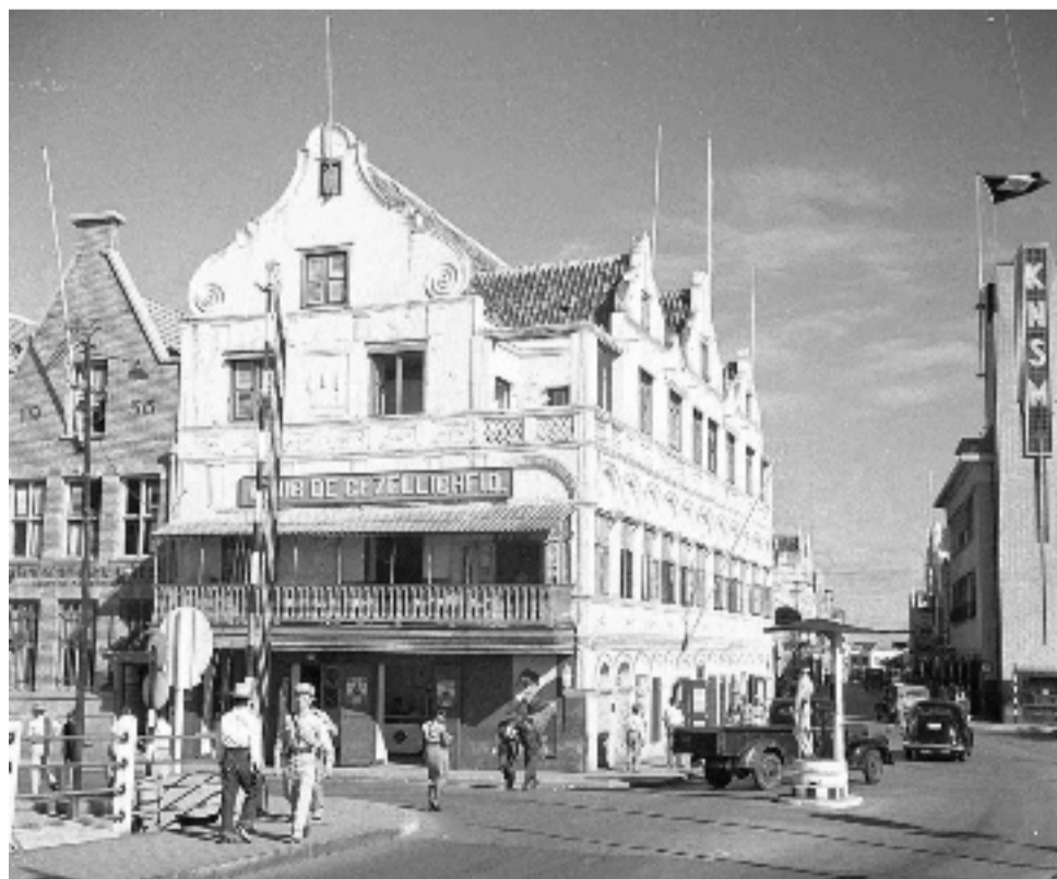
Club de Gezelligheid was lange tijd gehuisvest op de eerste verdieping van het Penha-gebouw in Punda.