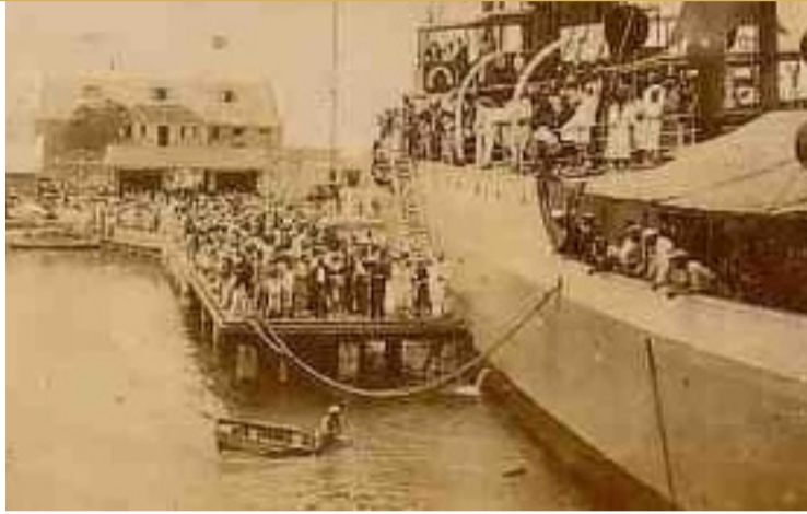
De Baralt met supporters van Sparta kom aan op Bonaire.